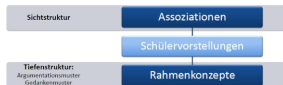
Abb. 1: Assoziationen und Rahmenkonzepte

Der Oberbegriff „Schülervorstellungen“ fasst all jene Vorkenntnisse, Vorstellungen und Vorerfahrungen zusammen, die Schülerinnen und Schüler zu einem bestimmten Lerngegenstand mitbringen. Viele der grundlegenden empirischen Studien zu Schülervorstellungen, zumindest im Bezug auf Energie, stammen aus den 1980er bis 1990er Jahren und diese setzten dabei oft unterschiedliche Schwerpunkte. Die Untersuchungen zu Schülervorstellungen über Energie, die sich auch auf den vorunterrichtlichen Bereich erstrecken, lassen sich grob in zwei Sphären unterteilen: Die Untersuchungen zu dem im deutschsprachigen Raum sehr bekannten Assoziationstest zur Energie von Duit [1] sowie verschiedene internationale Untersuchungen (in erster Linie qualitative Analysen von Schülerinterviews) zur Analyse der den Schülervorstellungen zugrunde liegenden Rahmenkonzepten [2+15+16]. Grundsätzlich untersuchen die Assoziationsanalysen dabei eher eine direkt einsehbare Sichtstruktur, während die Untersuchungen zu den Rahmenkonzepten eine Fokussierung der Tiefenstruktur der Schülervorstellungen vornehmen (siehe Abb. 1).