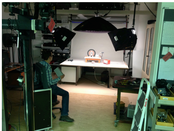
Abb. 1: Das IBE-Labor der AG Didaktik der Physik an der Freien Universität Berlin. Links oben ist die digitale Aufnahmekamera zu erkennen, die für das Stopp-Trick-Animationsverfahren auf einem schweren Säulenstativ fixiert ist. Der Experimentator variiert systematisch die Parameterwerte im Experiment und fotografiert den zugehörigen Zustand. Die computergesteuerte Kamera wird dabei fernausgelöst.

Diese Form der Interaktivität erzeugt beim Lernen die Illusion des unmittelbaren Umgangs mit dem abgebildeten realen Objekten im Experiment. Zwar geben IBE eine experimentelle Anordnung vor und schränken mögliche Interaktionen auf die im Realexperiment erfassten Zustände und Abläufe ein, aber diese im Vergleich zum Virtuellen Labor als Simulationsexperiment bestehende Einschränkungen sind didaktisch nutzbar, um Lernaktivitäten gezielt zu gestalten. Beispiele sind Experimente, die in der