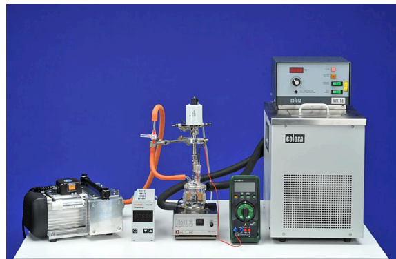
Abb. 3: Dieses IBE ermöglicht ohne jede Gefahr die Untersuchung des Zusammenhangs zwischen Druck und Temperatur einer toxischen Flüssigkeit. Die Geräte des Aufbaus lassen sich über realitätsbezogene Gesten bedienen, alle relevanten Vorgänge multimodal wahrnehmen und Messwerte in Echtzeit ablesen.

Im Falle einer Schwangerschaft sind Studentinnen oft gezwungen, Praktika bis zum Ende der Stillzeit zu unterbrechen. Experimente in Laborfächern, bei denen häufig auch mit toxischen Präparaten hantiert wird, stellen dann ein grundsätzliches Tabu dar. IBE ermöglichen es, ohne toxische Belastungen und zeitlich flexibel, reale Experimente vom Heimarbeitsplatz aus virtuell nachvollziehbar zu machen. In Kooperation mit Lehrenden aus den Fachgebieten Chemie, Biologie, Veterinärmedizin und Physik wurden IBE problematischer Experimente erstellt, die über das Learning Management System der Freien Universität Berlin zu folgenden Themen jederzeit und überall verfügbar sind. Ein erster Schritt zur Flexibilisierung der Praktika [22].