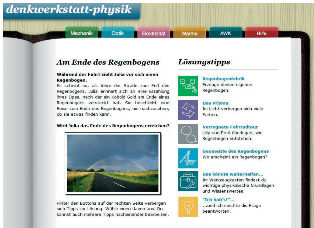
Abb. 2: Startseite der Aufgabe ‚Ende des Regenbogens‘

Mit dem Button ‚Ich hab’s!‘ kann die Frage, ob das Ende des Regenbogens erreichbar ist, beantwortet werden. Angeboten werden vier Antworten, von denen eine richtig ist. Im vorliegenden Fall differenzieren die Antwortmöglichkeiten nicht nur nach ‚ja‘ und ‚nein‘, sondern die fehlerhaften Antworten thematisieren das Vorhandensein von Regentropfen, die Intensität der Sonneneinstrahlung oder die Größe des Regenbogens. Die richtige Antwort geht auf den Standort der beobachtenden Person in Bezug zum Regenbogen, den die Person wahrnimmt, ein. Nach einem ‚Klick‘ auf die richtige Antwort wird eine kurze Begründung angezeigt, die noch durch eine ausführliche Erklärung ergänzt werden kann. Dabei wird auch auf die Bogenform des Regenbogens eingegangen. Wählt man eine falsche Antwort aus, so folgt ein Hinweis auf die Lerntipps, die zum Auffinden der richtigen Lösung genutzt werden können. Gleichzeitig wird in diesem Fall der Lösungsbutton deaktiviert, bis einer der Tipps vollständig bearbeitet wurde. Dadurch soll ein Vorgehen nach dem Prinzip ‚trial-and-error‘ unterbunden werden.