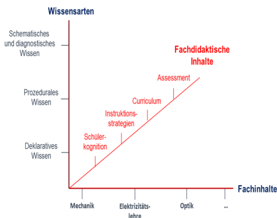
Abb. 2: Modellierung des physikalischen und physikdidaktischen Wissens nach KiL . (Kröger, 2013)

Physiklehrkräften zu erforschen. Dabei nutzen viele Studien die Aufteilung des Professionswissens in fachliches, fachdidaktisches und pädagogisches Wissen aus der COACTIV (Baumert, 2011). So versucht das Projekt ProWiN (Professionswissen in den Naturwissenschaften) das Professionswissen für naturwissenschaftliche Lehrkräfte zu erfassen (Tepner, 2012). Weiter ausspezifiziert soll sowohl in ProfiLe-P (Professionswissen in der Lehramtsausbildung Physik) (vgl. Gramzow, 2013) als auch in KiL (Messung professioneller Kompetenzen in mathematischen und naturwissenschaftlichen Lehramtsstudiengängen) (vgl. Kröger, 2013) das fachliche und das fachdidaktische Professionswissen von Physiklehrkräften zu modelliert und erfasst werden. Im Weiteren wird das Kompetenzmodell der Studie KiL näher vorgestellt. In KiL werden das physikalische und das physikdidaktische Wissen in einem Kompetenzmodell dargestellt.