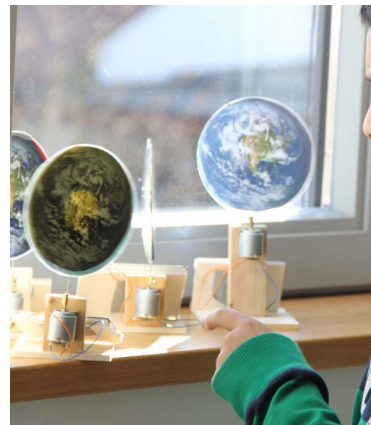
Abb. 4: In der Solarwerkstatt gebautes Modell

In der Oberstufe gibt es Angebote für die an bayerischen Gymnasien neuen Projekt- und Wissenschaftspropädeutischen Seminare [5]. Als erstes Projekt ist in der Solarwerkstatt eine funktionsfähige Solarthermieanlage aufgebaut worden. Mit einem Röhrenkollektor wird Wasser erwärmt. Eine Umwälzpumpe mit Temperaturregelung und Stromversorgung mittels eines selbstgebauten Photovoltaikmoduls gehören zum Umfang der Projektarbeit. Eine Laderegelung für einen Blei-Akku ist aus einem Elektronikbausatz aufgebaut worden.