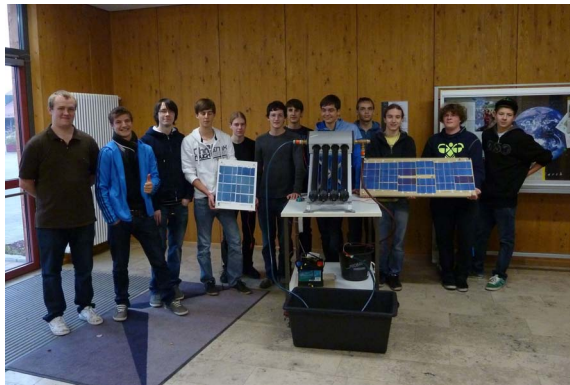
Abb. 5: Mit einem selbstgebauten Photovoltaik-Modul werden die Wasserpumpe und die Regelung für einen Sonnenkollektor betrieben.

Schülerinnen und Schüler motiviert und ihnen Gelegenheit gibt sich in unterschiedlichen Ansätzen mit den erneuerbaren Energien auseinanderzusetzen. Physikalische Zusammenhänge sind nach Dietmar Höttecke [6] unbedingt erforderlich um „sowohl in politischen, gesellschaftlichen als auch persönlichen Feldern handlungs- und entscheidungsfähig zu sein“. Ein der Schule angegliederter Klimaschutz- und Solarförderverein [7] unterstützt und koordiniert dabei die Aktivitäten in diesem Bereich.