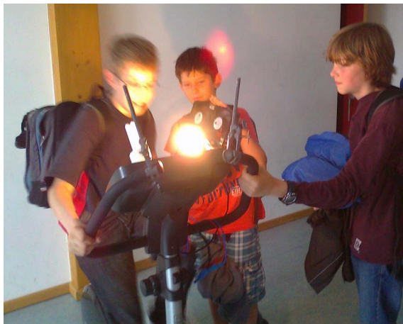
Abb. 3: Elektrische Energie durch Muskelkraft zu erzeugen ergibt ganz neue Einblicke

Besonders an Projekttagen besteht die Möglichkeit an Lernstationen zum Thema Energie Einsichten durch praktische Erfahrungen zu vertiefen.